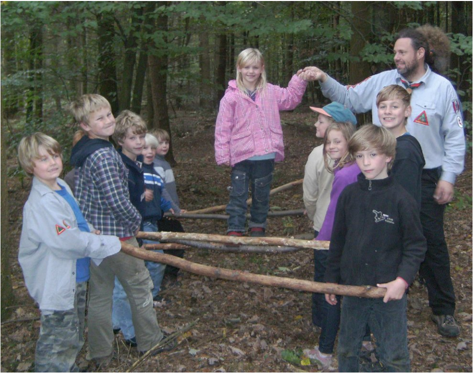
Herbstlager der WesleyScouts, Oktober 2011