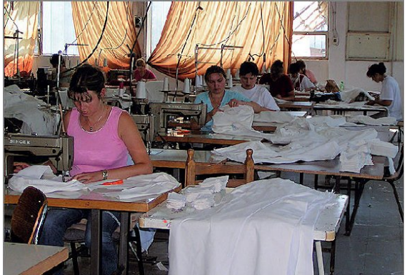
Herstellung der Jacken und Hosen in Mazedonien selbst

Nachdem die Aktion »Winterjacken für Roma-Kinder« 2006 ein großer Erfolg war und vielen Kindern in und um die Hauptstadt Skopje geholfen werden konnte, erreichte uns die Anfrage, dieses Jahr den Roma in und um Strumica zu helfen.