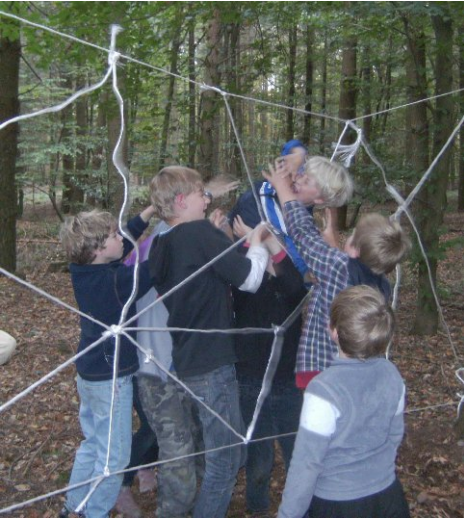
das Netz der giftigen Spinne!

Und natürlich wurde auch der ein oder andere Schatz, auch im Dunkeln, gehoben.